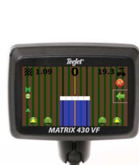
КОНСОЛЬ MATRIX 430VF