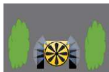
Навісні й причіпні