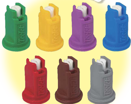
NEW AIXR-VKセラミック製チップ