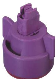
AIXRチップ及びキャップ